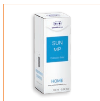
ElectroDerma SUN MP