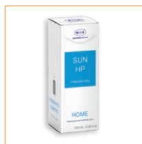
ElectroDerma SUN HP